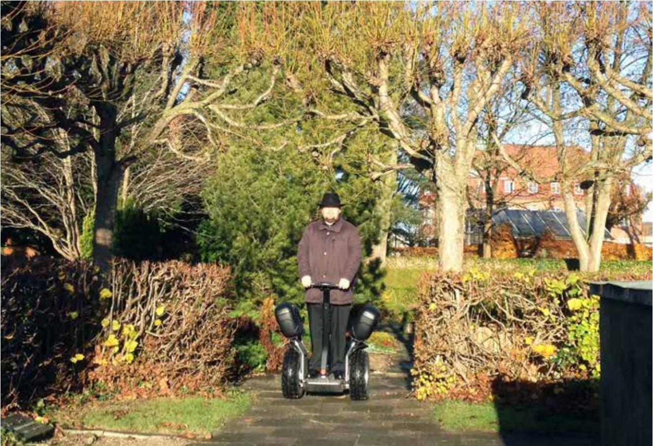
Selfie på Segway – utroligt hvad man kan med en smartphone...

Assistenskirkegården, havde vi en på prøve i en uge.