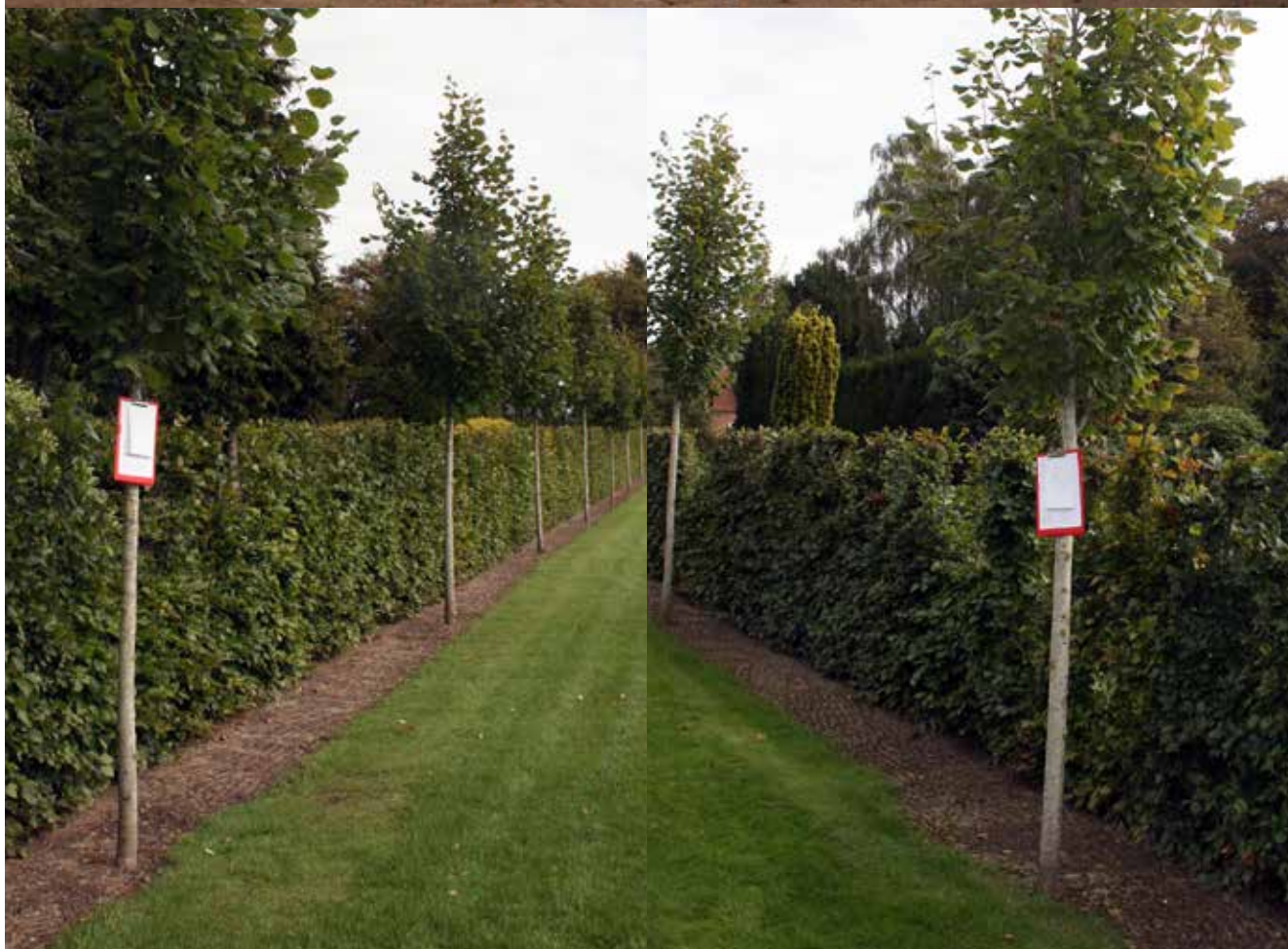
Flot ny lindeallé på Tønder Kirkegård. Læg mærke til den græsfri zone ved basis af træerne. Afstanden fra kanten af græsset til stammerne er for lille, men kort efter fotos blev taget, er der fjernet en stribe græs, så plæneklipperen kan holde den fornødne afstand til den sårbare bark på træerne.