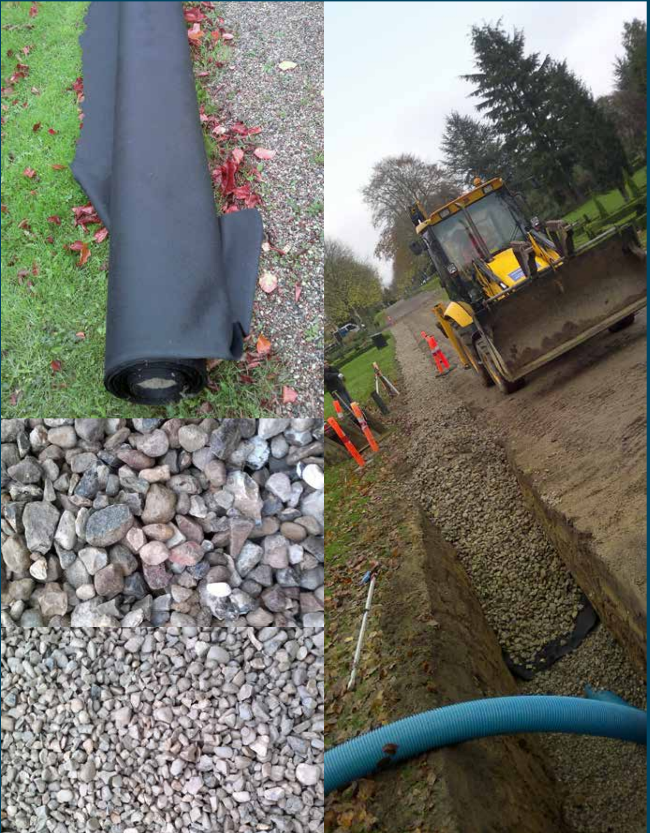
I bunden af dræn rønden er der lagt et drænrør som dækkes med perlesten (8 – 16 mm) og nøddesten (20 – 32 mm), adskilt af et lag fibertex.