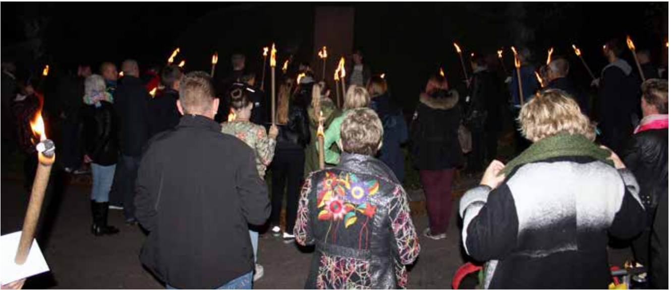
På Kulturnatten kan man – i faklernes skær – høre historier om nogle af de kendte og mindre kendte personligheder, der ligger på Bispebjerg Kirkegård.