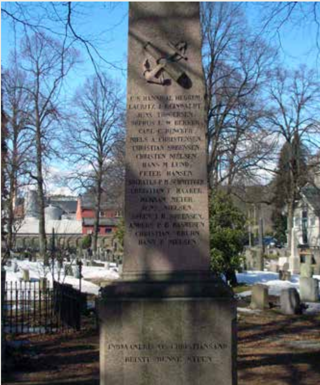
Kristiansand: mindesmærke over faldne i slaget ved Helgoland, maj 1864.