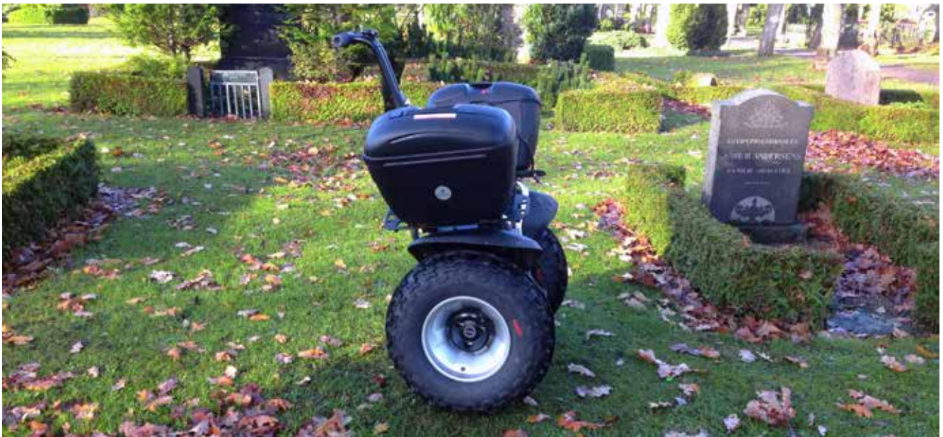
Kirkegårdskontorets Segway x2 SE. Rumindholdet i tasken svarer nogenlunde til 3 stk. 2 liters flasker.

Tekst og foto af Casper Nicolai Khalik Vett, cnpv@odense.dk Landskabsarkitekt MDL ved Odense Kommunale Kirkegårde